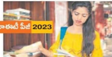
సీయూఈటీ పీజీ 2023