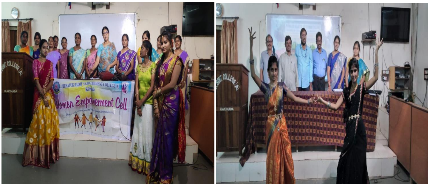
Fancy Dress Competition and Dance Competition conducted by Women Empowerment Cell on 06-01-2022

As the part of the tradition and culture of the college every year, The Women Empowerment Cell organized number of competitions like traditional dress, mehendi and Rangoli competitions among the girl students. The food festival with sixteen stalls was also arranged by the students as the part of their entrepreneurship. Prizes were also distributed to the winners and the participants.