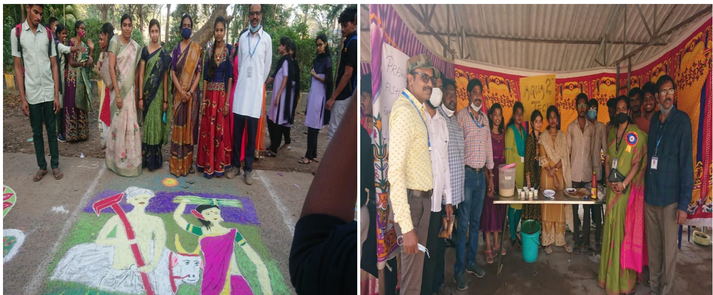
Rangoli and Food Festival on 07-01-2022

An International Conference on “New Forays of Luminescent Advanced Materials and Phosphors in Multidisciplinary Technologies” conducted by Physics and Chemistry Departments on 07-01-2022 :