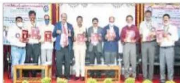
సదస్సు బ్రోచర్ను ఆవిష్కరిస్తున్న అతిథులు